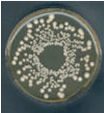
FIGURA 3 Azione inibitrice di lieviti antagonisti evidenziata su piastra Petri