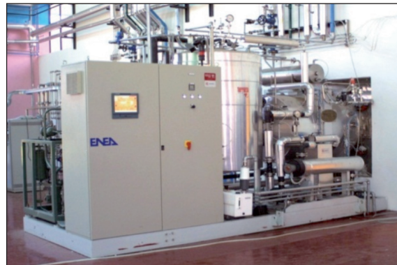
FIGURA 7 Unità Operativa Pilota di Liofilizzazione (Capacità di carico 3 mq), Hall Tecnologica Agrobiopolis, Centro Ricerche Trisaia

l'ENEA ha messo a punto una metodologia finalizzata alla produzione su scala pilota (pre-industriale) di microrganismi antagonisti (lieviti del genere Pichia selezionati da ambienti naturali) da impiegare in programmi di lotta biologica in fase di pre-raccolta ed in post-raccolta contro funghi patogeni agenti di decadimento della frutta (in particolare verso agrumi, uva e fragole) (figura 3).