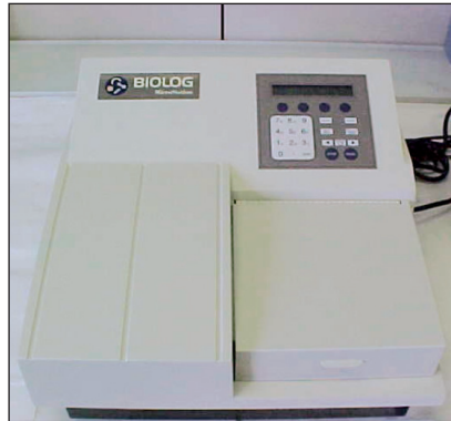
FIGURA 4 Stazione BIOLOG, Laboratorio Fitopatologia, Centro Ricerche Trisaia