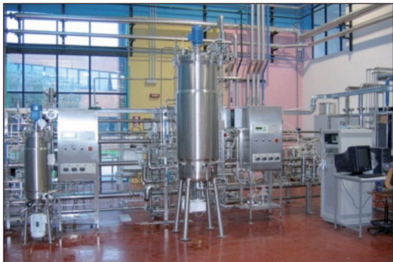
FIGURA 6 Unità Operativa Pilota di Fermentazione (50 e 500 litri), Hall Tecnologica Agrobiopolis, Centro Ricerche Trisaia