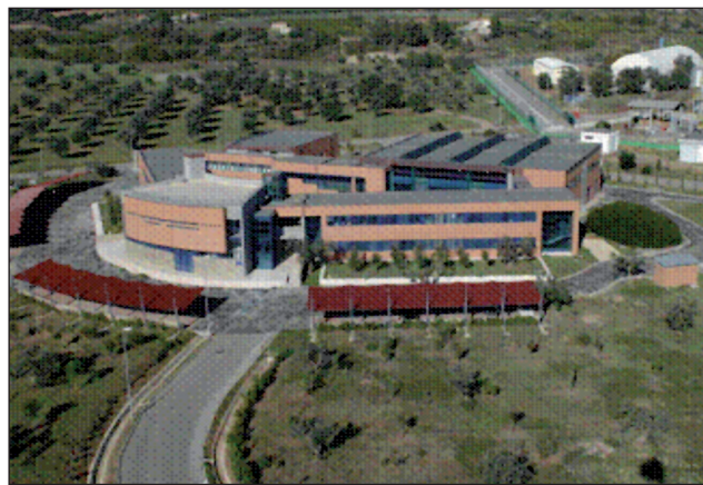
FIGURA 1 Centro di Innovazione Integrato Agrobiopolis

ed un Demo Center. La disponibilità contestuale di Laboratori Specialistici attrezzati con strumentazioni avanzate e di Unità Operative Pilota installate nella