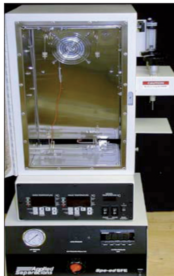
FIGURA 9 Impianto CO 2 SFE da Laboratorio (Capacità fino a 1 litro), Laboratorio di chimica analitica Agrobiopolis, Centro Ricerche Trisaia

Le tendenze verso una alimentazione di qualità e "sostenibile", nel senso più ampio del termine, sono in costante crescita e compito del mondo della ricerca