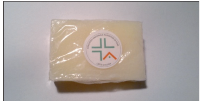
FIGURA 12 Cosmetico a Base di liofilizzato di latte d'asina

di poter disporre di produzioni agroalimentari e zootecniche orientate a garantire il benessere e la salute. Il latte d'asina, per il suo particolare profilo biochimico, che lo rende il più simile a quello materno, è considerato per tali motivi già di per sé un nutraceutico particolarmente utile nell'alimentazione dei lattanti e nell'infanzia nei casi di intolleranza o allergie ad altri tipi di latte. La presenza nel latte d'asina di sostanze ad attività probiotica, di anticorpi e di composti azotati ad azione antibatterica, rende peraltro questo alimento molto utile anche nell'alimentazione delle persone anziane e debilitate. Altro impiego noto fin dall'antichità è inoltre quello cosmetico. Studi recenti su bambini allergici al latte vaccino hanno dimostrato che il latte di asina è tollerato dalla maggior parte di loro. Il sapore dolce lo rende infatti gradevole e ben accetto a differenza delle alternative