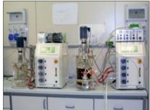
FIGURA 5 Fermentatori scala laboratorio, Laboratorio Camera Bianca Agrobiopolis, Centro Ricerche Trisaia

quali il post-raccolta ed il successivo stoccaggio, dimensioni che possono raggiungere anche il 60% di perdita del prodotto, con gravi evidenti ripercussioni economiche. Tra gli agenti di danno maggiormente significativi si annoverano principalmente i funghi fitopatogeni ed opportunisti, per il cui controllo e contenimento si utilizzano principi chimici ad attività fungicida. Tale consuetudine è accompagnata però dal crescente pericolo che possano essere trascinati nel prodotto finale residui chimici a livelli elevati e quindi potenzialmente tossici, con evidente rischio per il consumatore. In particolare la salubrità dei prodotti frutticoli è posta maggiormente a rischio quando l'uso dei fungicidi è effettuato dopo la raccolta, soprattutto nei casi in cui i tempi fra il trattamento ed il consumo sono ristretti, come spesso accade per specie quali gli agrumi, le fragole e l'uva. La legislazione vigente è in tal senso molto stringente e quindi, in teoria, non dovrebbero essere mai presenti, oltre certi limiti, residui di principi attivi nel prodotto "al banco". Nonostante ciò e nonostante i continui controlli, sia interni che esterni, è un rischio che oggettivamente esiste. Da tali osservazioni e da una serie di elementi di contesto più generale, quali la globalizzazione dei mercati, la mutata domanda di tipologia di prodotti da parte del consumatore, orientato maggiormente di un tempo verso le produzioni biologiche e comunque verso una maggiore qualità complessiva delle