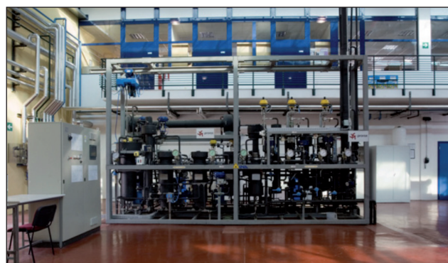
FIGURA 10 Unità Operativa Pilota CO 2 SFE (Matrici solide, liquide e viscosi; capacità fino a 15 litri), Hall Tecnologica Agrobiopolis, Centro Ricerche Trisaia

L'interesse legato a questa particolare produzione da parte degli operatori del settore va di pari passo con l'interesse mostrato dal consumatore verso i farma-food , o nutraceutici, ed il crescente desiderio