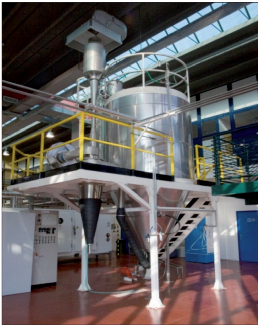
FIGURA 11 Unità Operativa Spray-dryer (Capacità 20 Kg/h), Hall Tecnologica Agrobiopolis, Centro Ricerche TRISAIA

di poter disporre di produzioni agroalimentari e zootecniche orientate a garantire il benessere e la salute. Il latte d'asina, per il suo particolare profilo biochimico, che lo rende il più simile a quello materno, è considerato per tali motivi già di per sé un nutraceutico particolarmente utile nell'alimentazione dei lattanti e nell'infanzia nei casi di intolleranza o allergie ad altri tipi di latte. La presenza nel latte d'asina di sostanze ad attività probiotica, di anticorpi e di composti azotati ad azione antibatterica, rende peraltro questo alimento molto utile anche nell'alimentazione delle persone anziane e debilitate. Altro impiego noto fin dall'antichità è inoltre quello cosmetico. Studi recenti su bambini allergici al latte vaccino hanno dimostrato che il latte di asina è tollerato dalla maggior parte di loro. Il sapore dolce lo rende infatti gradevole e ben accetto a differenza delle alternative